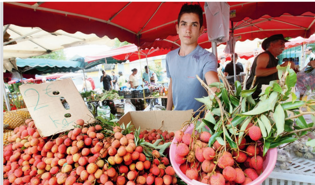
«Le but n'est pas de manger cinq fruits et légumes par jours, mais cinq portions quotidiennes Mais l'essentiel est surtout d'en consommer régulièrement» (photo d'archives).