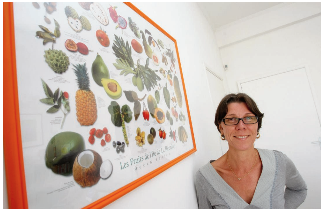
«En matière d'alimentation, c'est un paradoxe : nous sommes à la fois inondés de produits et entourés d'interdits»